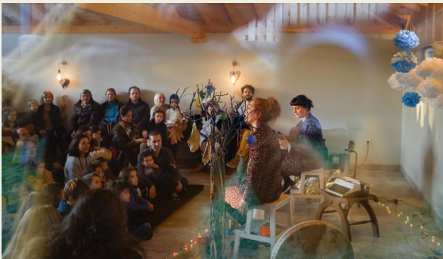
BIBLIOTECA MUNICIPAL MANUEL ALEGRE – ÁGUEDA