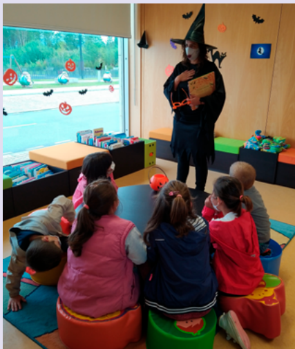
BIBLIOTECA MUNICIPAL DE ANADIA