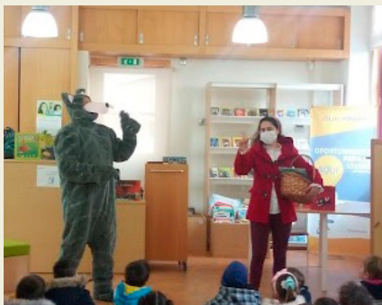
BIBLIOTECA MUNICIPAL JOÃO GRAVE – VAGOS