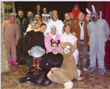
BIBLIOTECA MUNICIPAL DE ILHAVO

Balcão de atendimento da Biblioteca Municipal | geral@bm-anadia.pt | Tel. 231 519 090