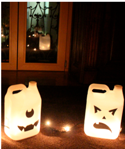
BIBLIOTECA MUNICIPAL DE ALBERGARIA-A-VELHA