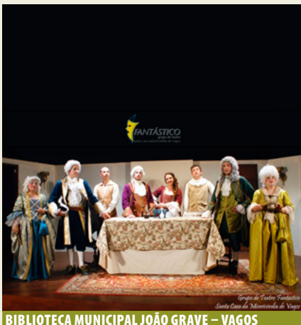
BIBLIOTECA MUNICIPAL JOÃO GRAVE – VAGOS