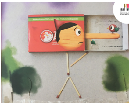
BIBLIOTECA MUNICIPAL MANUEL ALEGRE – ÁGUEDA

Promotor Município de Albergaria-a-Velha Público-alvo Famílias com crianças maiores de 3 anos