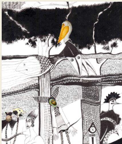
BIBLIOTECA MUNICIPAL DE ALBERGARIA-A-VELHA

No âmbito das comemorações do seu 7.º aniversário, a Biblioteca Municipal João Grave vai percorrer em itinerância todas as Bibliotecas Escolares do concelho de Vagos, apresentando a sua sessão de contos encenados e um conjunto de atividades dirigidas ao público infantil.