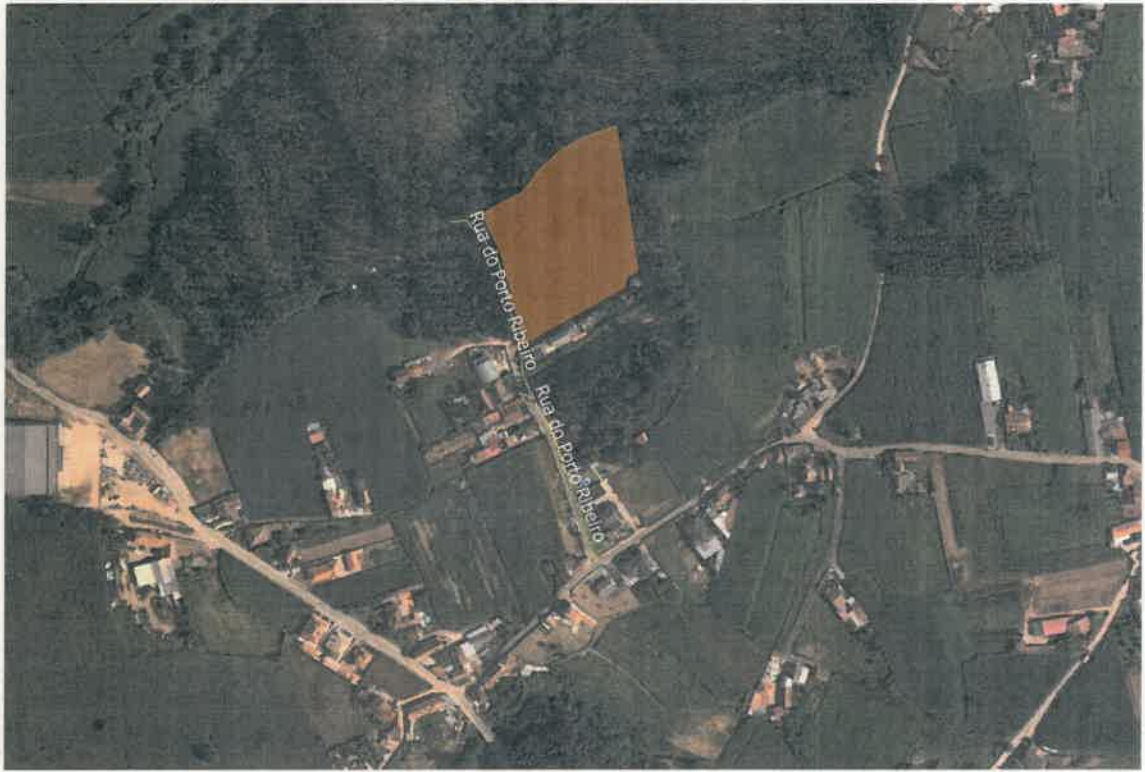
Figura 1 - Localização dos terrenos

Para constar se publica o presente Edital e outros de igual teor, que serão afixados, nos termos do nº 3 do artigo 112º do CPA, nos lugares de estilo, bem como no site da Câmara Municipal em www.cm-ovar.pt . -----