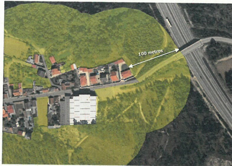
(Figura 2. Exemplo da Faixa dos aglomerados populacionais, com 100 m de largura, onde é obrigatória a limpeza da vegetação, conforme o ANEXO I.)

---Os critérios a aplicar nas faixas de gestão de combustível mencionadas anteriormente, devem ser os constantes do ANEXO do Decreto-Lei n.º 124/2006 de 28 de junho, na sua redação atual, que se anexa ao presente EDITAL (ANEXO I).-----