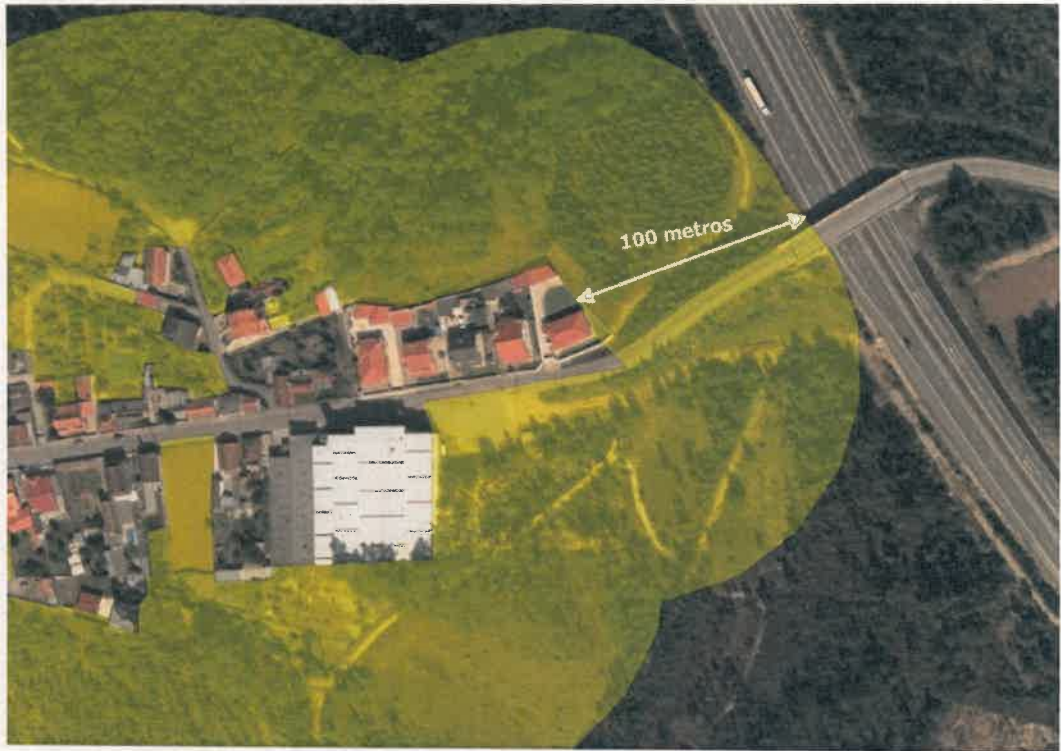
(Figura 2. Exemplo da Faixa dos aglomerados populacionais, com 100 m de largura, onde é obrigatória a limpeza da vegetação, conforme o ANEXO I.)

Os critérios a aplicar nas faixas de gestão de combustível mencionadas anteriormente, devem ser os constantes do ANEXO do Decreto-Lei n.º 124/2006 de 28 de junho, na sua redação atual, que se anexa ao presente EDITAL (ANEXO I).-----