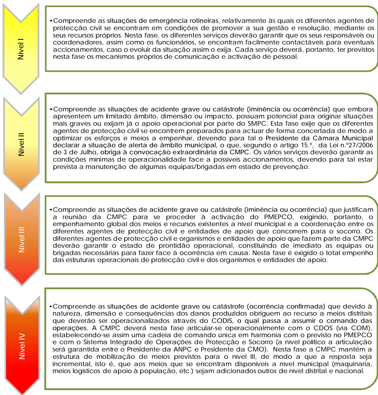
Figura 2. Níveis de intervenção na fase de emergência